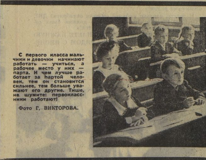
С первого класса мальчики и девочки начинают работать — учиться, а рабочее место у них — парты. И чем лучше работает за партой человек, тем он становится сильнее, тем больше уважают его другие. Также, не шумите: париклассные работают!

С. ЦЫМБАЛЕНКО. (Наш корреспондент). г. Свердловск, школа № 134.