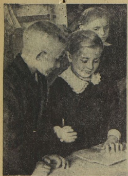
Это ведь очень хорошо, когда товарищ однокласснику помогает, какие у тебя оценки. И порадоваться за тебя. Узнать, какие ты прочитал книги, и победить в библиотеке, чтобы найти их. Потом на перемене или по дороге из школы поговорить о прочитанном. А если каждый из одноклассников будет знать, чем живёт, чем интересуется его товарищ? Тогда при такой класс скажут: «Вот дружные ребята!»